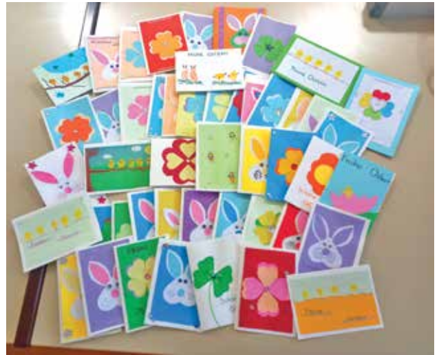
Voščilnice za nemške in avstrijske domove starostnikov ...