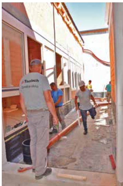
6. 6. 2022 - dela lepo tečejo ...