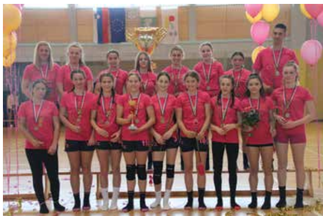
Starejše deklice B - sezona 2021/22 - državne prvakinje ...

Pride pa čas, ko otroci prerastejo mini rokomet in hodijo na vadbo v Rače. Tako to že leta počnejo dekleta letnika 2008, ki so v letošnji sezoni z ekipo RK Rače postala državne prvakinje v kategoriji starejših deklic B. Ta dekleta so morala zadnji 2 leti iti čez ovire, saj se jim je dvakrat prekinilo tekmovanje, ko so bile na poti k uspehu, skoraj 9 mesecev treningov prek računalnika zaradi korone, treningi zunaj, pa testiranja, karantene, izolacije, tekme brez gledalcev, skoraj nič trening tekem in turnirjev, treningi z omejitvami, maske ... Dekleta in njihova trenerka so to zdržale in kar se je letos pokazalo v izjemnem rezultatu. Dekleta so odigrala 8 tekem v predtekmovanju, kjer so zabeležila vseh 8 zmag z gol razliko 236 : 146, torej + 90 golov. Tudi v ligi za prvaka so odigrala 8 tekem in gol