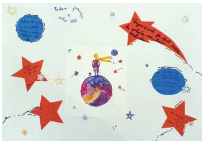
Prijazne in spodbudne misli učencev, ki obiskujejo DSP ...