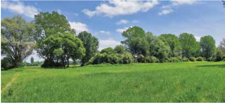
Mejice so zadnja pribežališča organizmov v kmetijski krajini ...