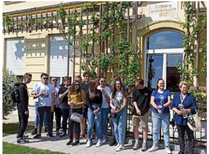
Študenti turizma ob potomki stare trte ...