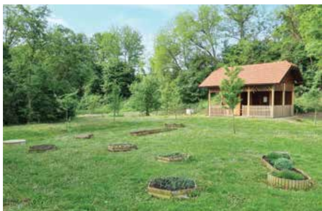
Zanimive gredice ...