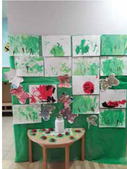
Naš končni izdelek - travnik ... Skupina Čebelice