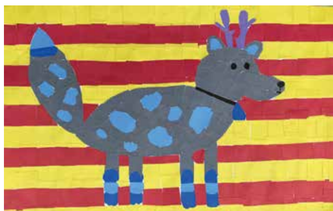
Ela Popovski, 5. a