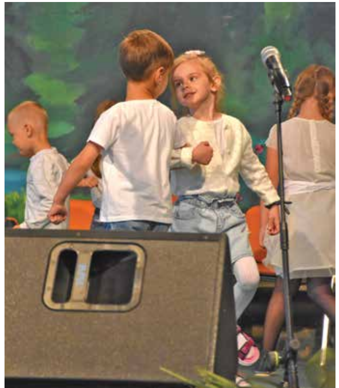
Najmlajši plešejo ...