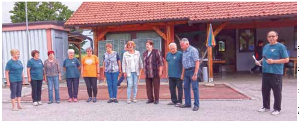
Bili smo veseli in smo zapeli ...