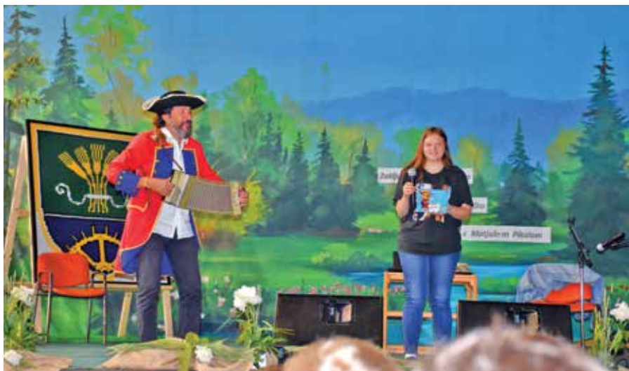
Pisatelj s »pomočnico« iz OŠ Starše ...