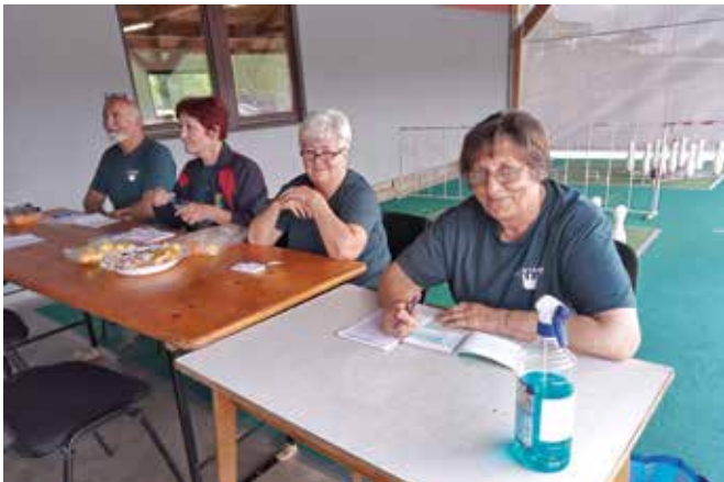
Po napornem delu je prijetno sestiti ...