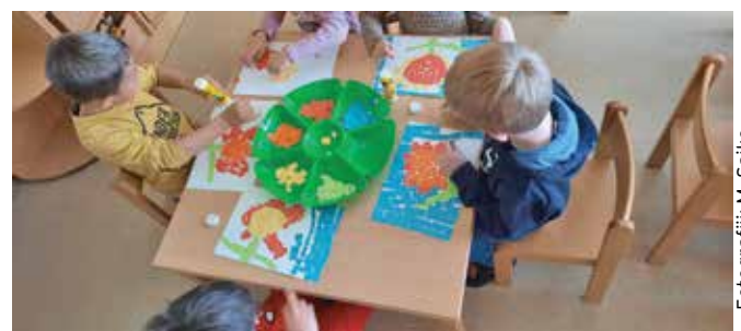
Izdelovanje mozaika ...