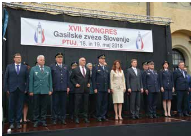
Kongres na Ptuj; drugič izvoljen ...

Francija vidim še vedno kot brata iz otroštva. Karakterno sva si različna. Kot otroka sva bila nagajiva in imela