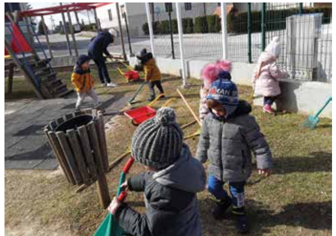
Tudi najmlajši v vrtcu skrbimo za lepo okolje ...