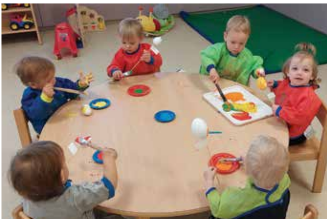
Navdušeni smo, ko lahko ustvarjamo z barvo in čopiči ... Skupina Kapljice