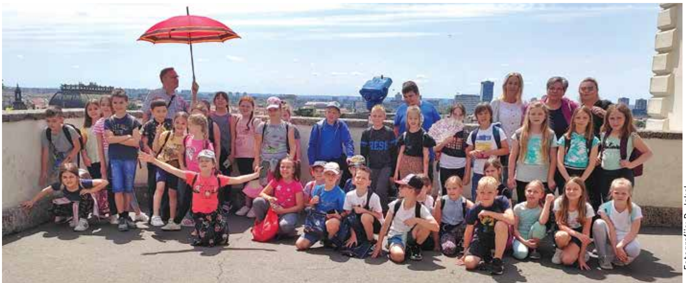
V zgornjem delu Zagreba - oba razreda skupaj ...