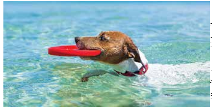
Poleti je zelo prijetno v hladni vodi ...

https://ysebovredn.triglav.si/druzina/s-psom-na-morje