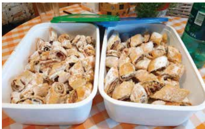
Mmm, kako teknejo ...

Recept v knjigi nosi naslov »Domače pecivo«, pri nas pa smo ga poimenovali kar »Mamino pecivo«, saj ga ona pripravlja že, odkar pomnim. Pa vedno je zelo dobro. Sedaj je svojo izkušnjo pri peki tega peciva prenesla že na