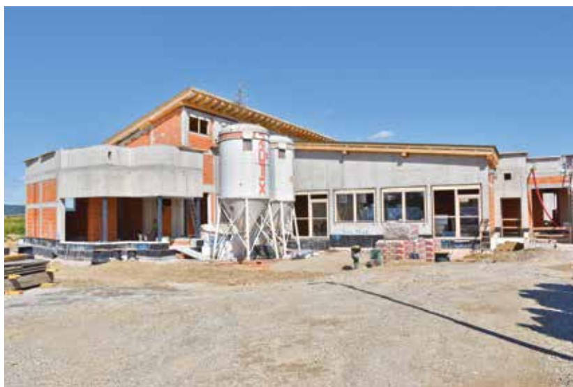
6. 6. 2022 - nova šola, vgrajena so že okna ...