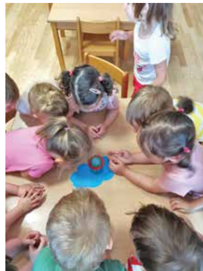
S pomočjo povečevalne lupe opazujemo mravljo ...