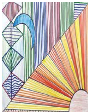
Maša Golob, 5. b Ment.: N. Vodošek Korže