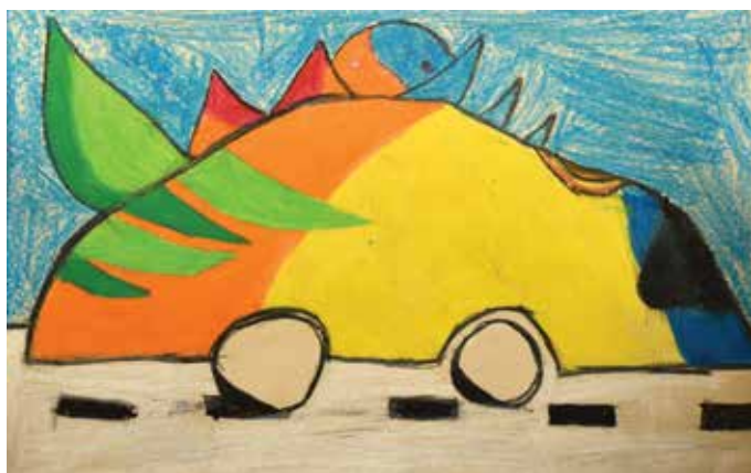
Zala Premzl, 4. b