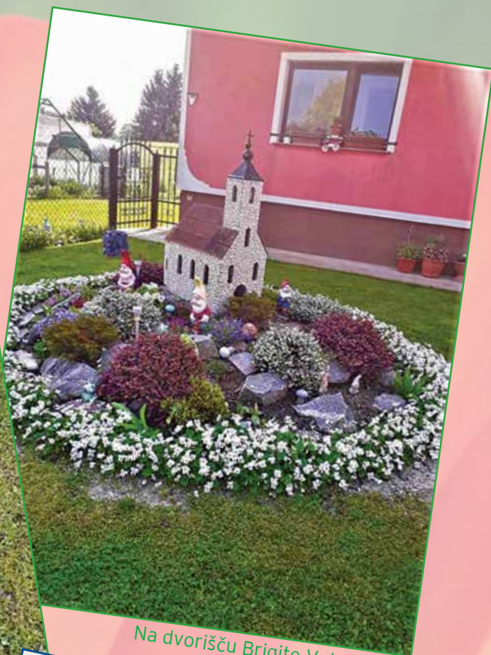
Na dvorišču Brigite Vukovič ... (zgornji sliki)