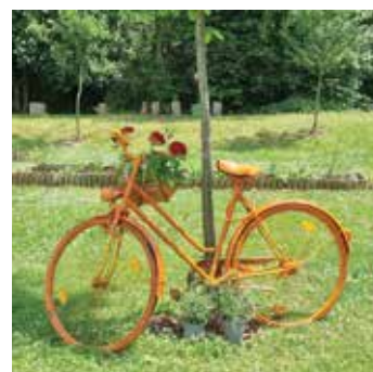
Kolo kot okras ...