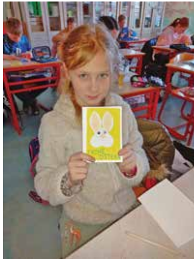
Petošolka med izdelovanjem voščilnic ...

Učenci 5. in 6. razredov so, v okviru razširjenega programa nemščine, sodelovali z Goethe Institutom v Ljubljani. Pridružili smo se akciji z naslovom "Ostern ist schöner mit dir" oz. "Velika noč je lepša s teboj". Učenci so izdelali čudovite voščilnice. Še posebej pa so se potrudili pri zapisu voščil v nemščini, saj so vedeli, da bodo naše voščilnice poslane v nemške in avstrijske domove starostnikov. Za sodelovanje se nam je Gothe Institut tudi že zahvalil. Prejeli smo različne družabne igre, s katerimi lahko učenci svoje znanje nemščine še nadgradijo in s pomočjo katerih je veselje do učenja nemščine še večje.