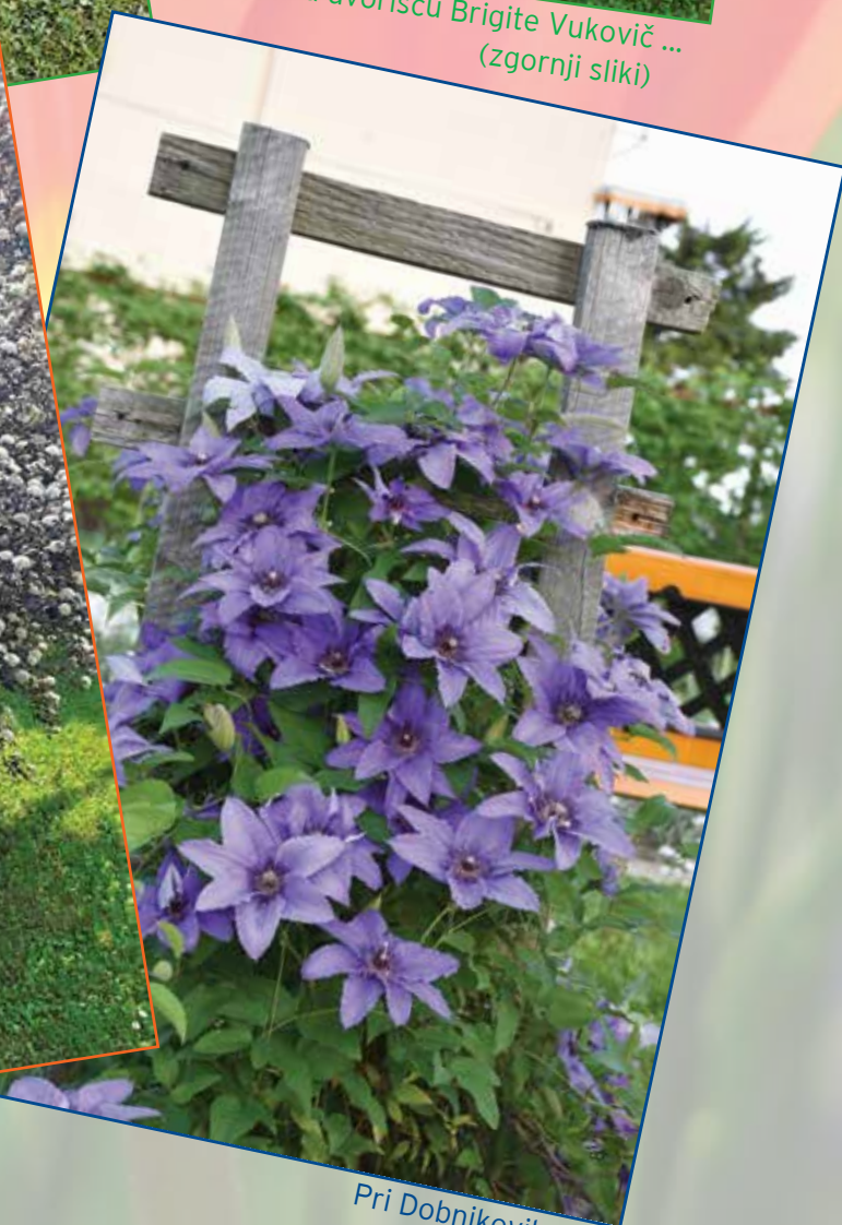
Pri Dobnikovih ...