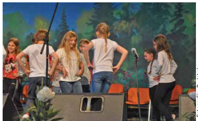
Tretješolci združimi moči - pri TJN ...