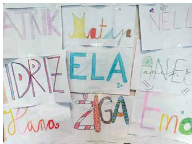
Imena petošolcev ...