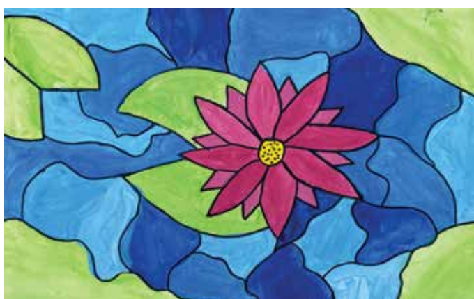
Patrik Skok, 5. b