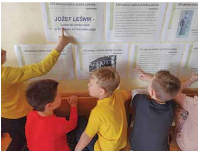
Ogled razstave o Jožefu Lešniku ...