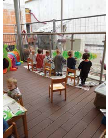
Slikarski atelje na vrteški terasi ...