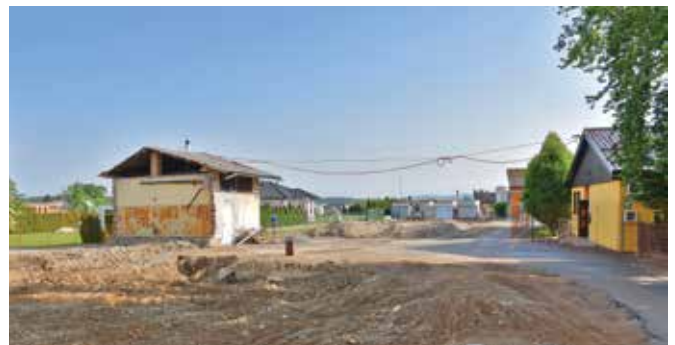
24. maj 2022 - stare šole ni več ...

V nadaljevanju se bodo izvajala dela v telovadnici z izvedbo akustičnih oblog ter športnega parketa. Prav tako se bodo konec meseca junija pričela keramičarska, slikopleskarska ter mavčnokartonska dela. Konec meseca junija se bo pričela tudi izvedba fasade objekta. Sočasno bodo potekala dela na zunanji okolici z izvedbo kanalizacije, robnikov in tlakovanja.