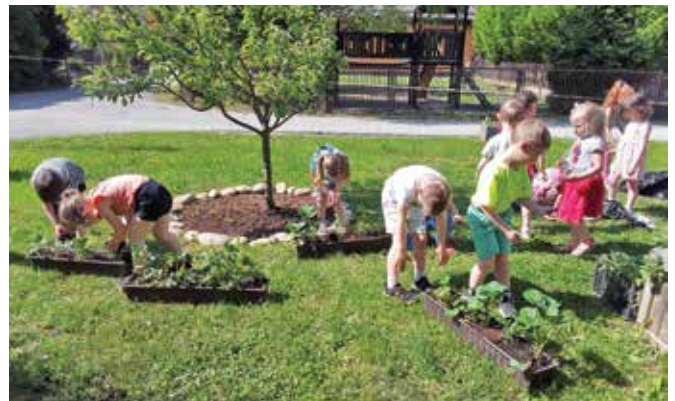
Mali vrtnarji ...

Da nam to omogočeno bo, pred vrtcem visoko gredo Pampers postavijo. Otroci že na vrt hitijo in se nove pridobitve veselijo.