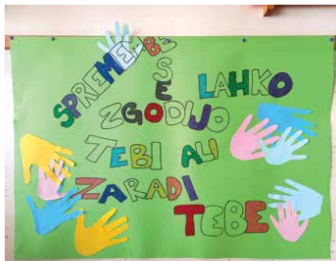
Izdelan plakat pove veliko ...

Ob takšni vnemi učencev in zadovoljstvu učiteljev ne bo težko načrtovati tedna za spremembe tudi v letu 2023.