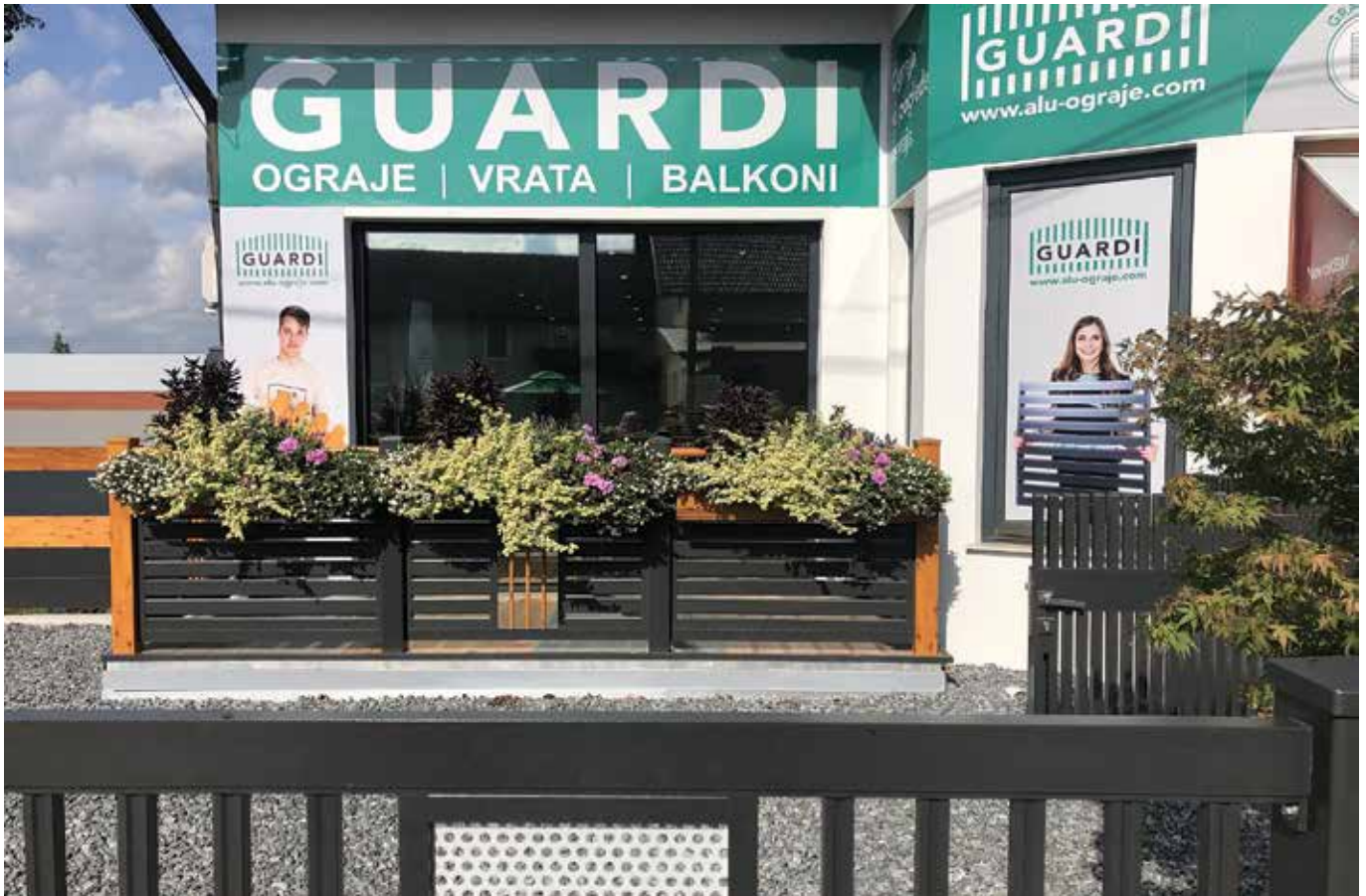
Razstavní salon v Staršah ...

liva, da nas je danes v podjetju 15, sva resnično ponosna. Seveda se je s tem tudi odgovornost povečala. Že prvo leto ob odprtju sva si zadala cilj, da bi bila med tremi najbolj prepoznavnimi ponudniki ograj v Sloveniji. Cilj smo dosegli in na to sva danes ponosna.