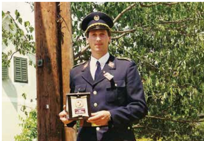
Prejeto priznanje iz Avstrije ...