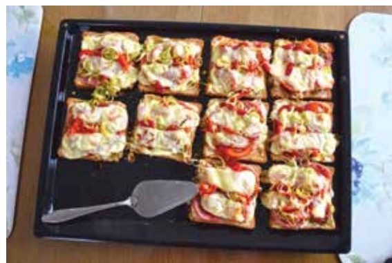
Kruhki so odišavili kuhinjo; pa še okusni so ...

Ves nadev malo posolimo, nato pa sestavine prekrijemo še s široko rezino polmastnega ali mastnega sira ali vse potrosimo kar z naribanim sirom. Kruhki so sedaj pripravljene za v pečico.