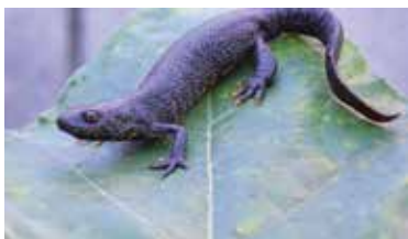
Veliki pupek ... https://drava-natura.si/vrste/veliki-pupek-in-hribski-urh

Podrobnejše informacije so dostopne na www.gov.si/zbirke/projekti-in-programi/zadovol/ .