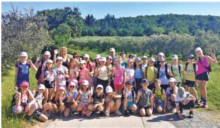
Pozdrav 3. a in 3. b z razredničarkama ...

Naslednji dan so izdelovali lučke za nočni pohod, in prav gotovo vrhunec šole v naravi doživeli z izletom v Izolo, kamor smo se odpeljali z ladjico. Da je to resnično veselje, so kazali nasmejani obrazi otrok ob prepevanju različnih pesmi. Seveda pa se je dogajalo še mnogo več, zlasti večerne animacije, kjer prav gotovo zmaga »odštekan stil«. To je večer, ko se učenci spremenijo v modne navdušence in uprizorijo pravo modno revijo, podkrepljeno z razlago izbire svojega stila. Je večer poln smeha in