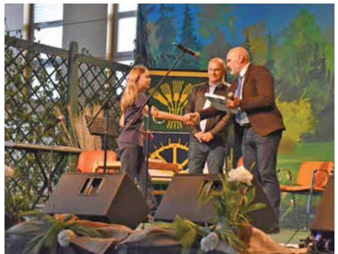
Predaja knjižnih nagrad učencem ...