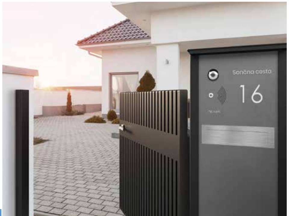
Vzorčni modeli ograj ...