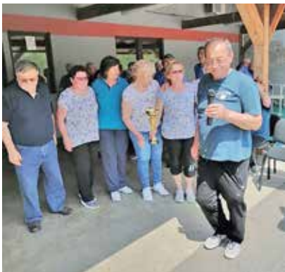
Zaslužili smo pokal ...