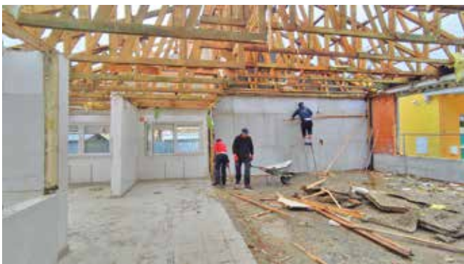
7. maj 2022 - odstranjevanje oblog v stari šoli ...

Stara šola se je pričela rušiti 3. 5. 2022 in je trenutno v celoti porušena-odstranjena, prav tako tudi kulturni dom in stara telovadnica. Na lokaciji stare šole se sedaj izvajajo gradbena dela za potrebe izvedbe parkirišč ter zunanjega športnega igrišča.