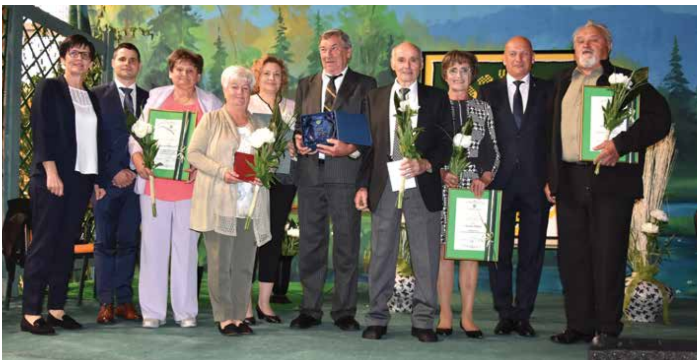
Po prejetju občinskih priznanj ...