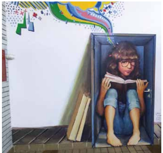
Poslikava - vhod v knjižnico ...

zde la knjiga zanimiva in celo poučna, smo se odločili, da jo spremenimo v dramatizacijo, v kateri so nastopali prav vsi učenci 3. b razreda.