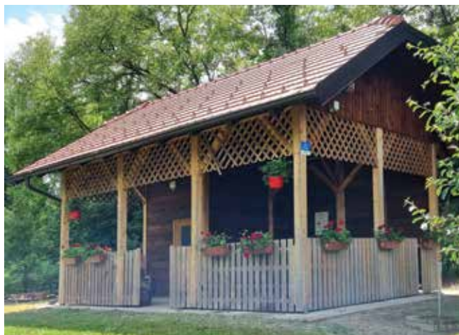
Hišica v cvetju ...

Če vas pot zanese mimo šole, si ga le oglejte, oglejte si ga tudi zvečer, ko gredice osvetlijo solarne lučke. Le