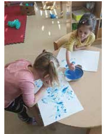
Ustvarjanje luž na papirju ...