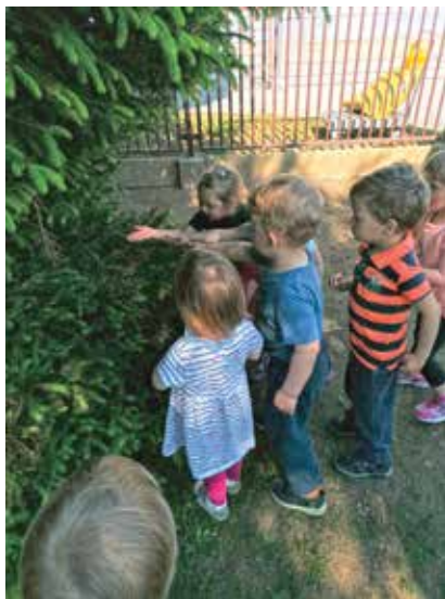
Opazujemo pajke in pajkove mreže ...

Med opazovanjem in raziskovanjem drobnih živali v njihovem življenjskem prostoru so otroci najprej opazili deževnika, mravlje, polža, metulja, čebele, čmrlja, pikapolonico in pajke na pajkovih mrežah. Glede na in-