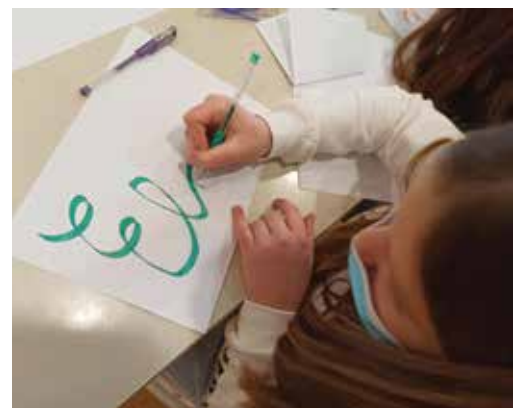
Šestošolci v vlogi pisarjev ...

Pisanje z roko je izvorna oblika pisne komunikacije, saj je rokopis vsakega posameznika edinstven, tako kot njegov prstni odtis. S pojavom digitalizacije je žal pričela izgubljati svoj pomen. S projektom tako ohranjamo tudi kulturo pisanja z roko.