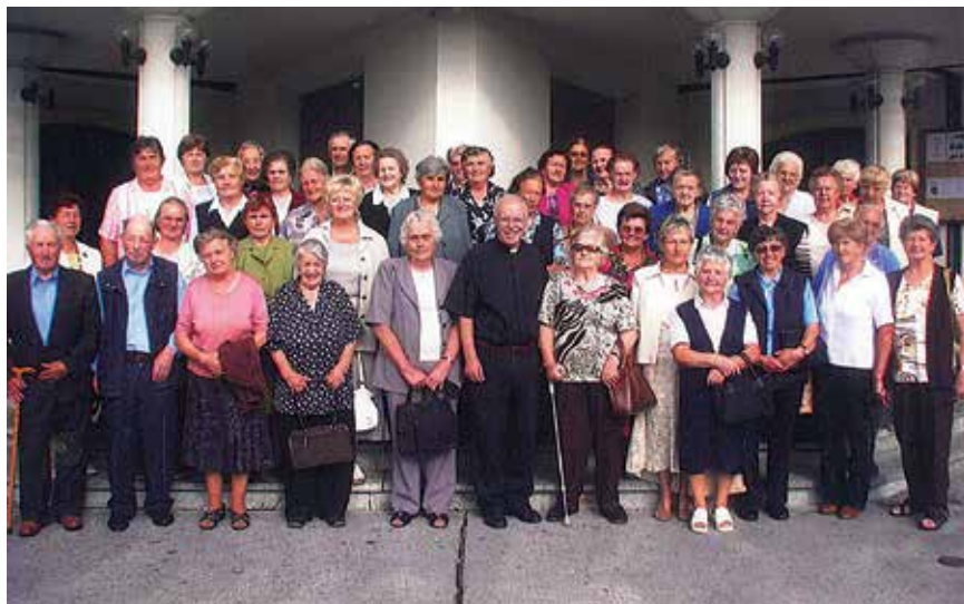
Slika starostnikov pred cerkvijo Sv. Duha v Celju, 2008 ...

Komu namenjamo pomoč? Vsakemu, ki je zlasti v materialni stiski. To je pomoč v hrani, oblačilih in denarnih sredstvih. Pomagamo tudi v primeru elementarnih nesreč, požarov in plačilnih položnic. V ospredju je pomoč otrokom iz socialno šibkih družin, za šolsko prehrano in druge