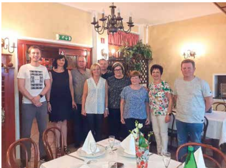
Naši krvodajalci s predsednico in podžupanom ...