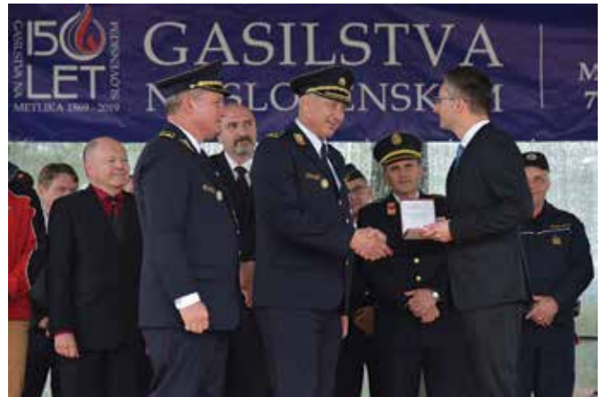
150 let gasilstva na Slovenskem - 2019...