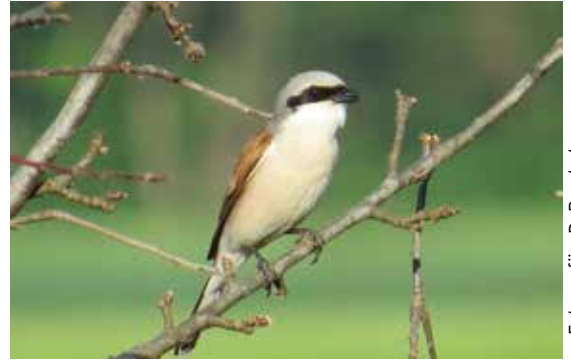
Rjavi srakoper izginja iz kmetijske krajine ...