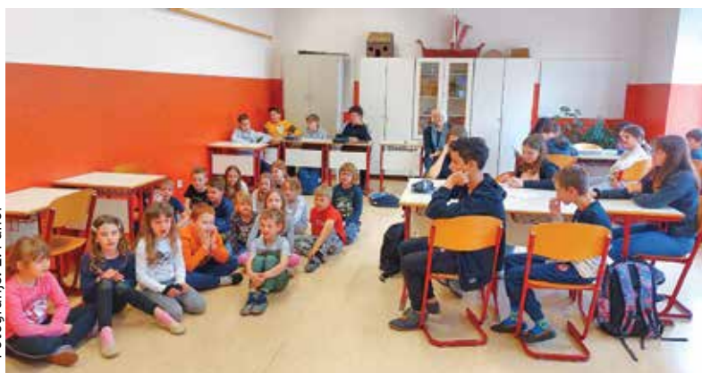
Skupni pouk ...