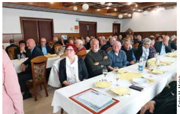
Množičen obisk na zboru članov ...

V nadaljevanju je predsedujoči podal predlog programa dela s finančnim načrtom za leto 2022 in poročilo, kaj je društvo delalo v I. tromesečju in kaj ima v programu v II. tromesečju. Predstavil je še finančni načrt, z dodatkom,