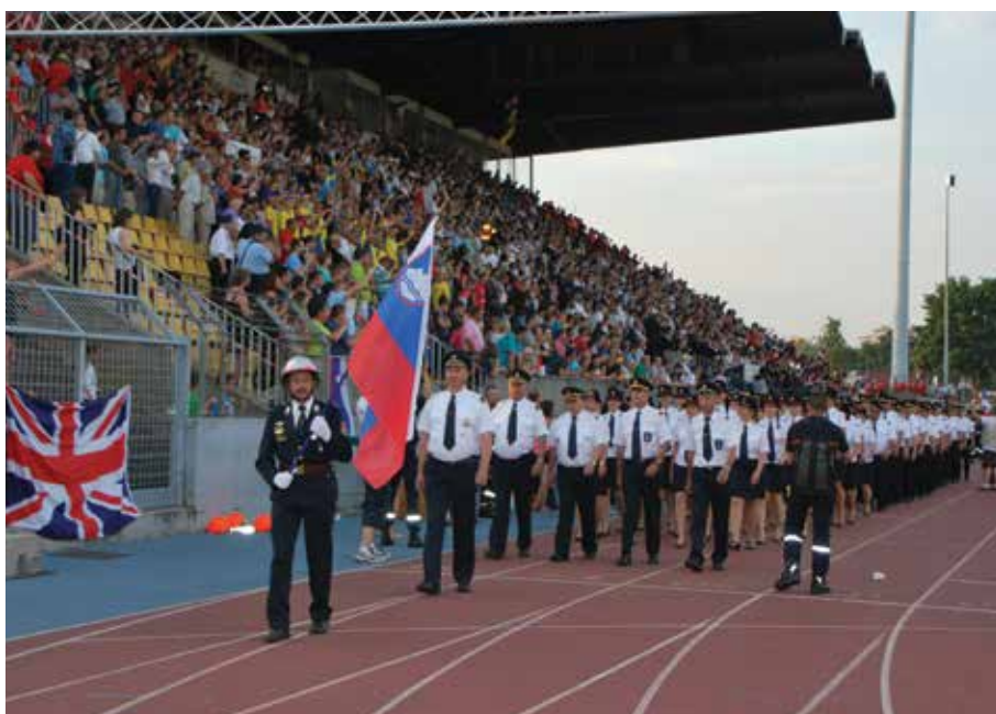
Gasilska olimpijada, Beljak 2017 ...