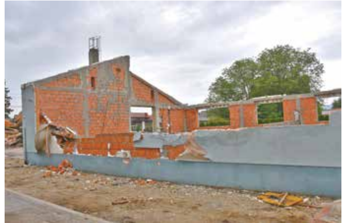
17. maj 2022 - strehe ni več ...

Trenutno so se izvajala krovsko kleparska dela, instalacijska dela (elektro ter strojne instalacije), izvedeni so ometi v kletnih prostorih ter estrihi, prav tako v kletnih prostorih. V pritličju se izvajajo elektro ter strojne instalacije. Prav tako so se zaključevala armirano betonska dela na vhodni avli.