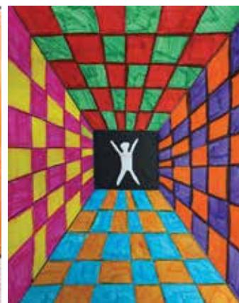
Danijel Ertl, 5. b Ment.: N. Vodošek Korže