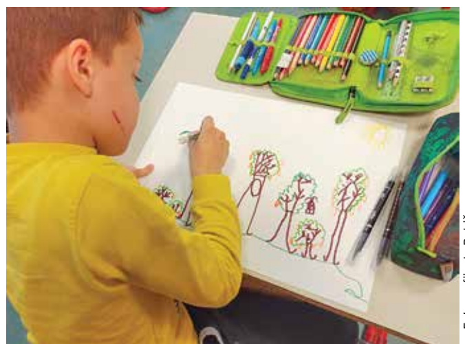
Risanje sadnega drevja ...