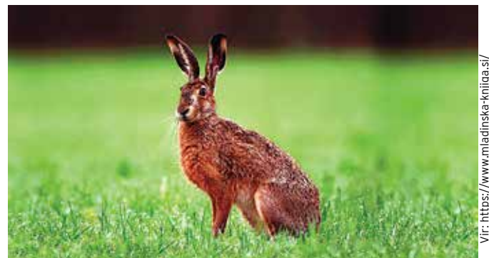
Poljski zajec ...