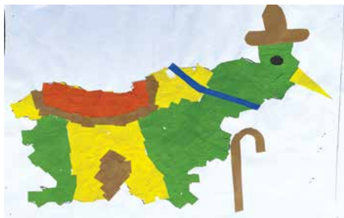
Kevin Kovačič, 5. b