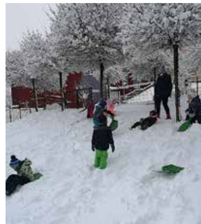
Veselje na snegu ...

Vsak dan smo opazovali vreme in vremenske pojave, ki smo jih grafično beležili na vremenskem koledarju. Otroci so razvijali grafomotorične spretnosti z risanjem kratkih navpičnih črt (dežne kapljice) ter poševne sončne žarke. Seznanili sva jih z nebesnimi telesi, kot so Sonce, Luna in zvezde.