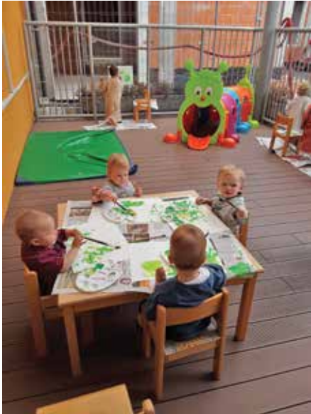
Naši najmlajši umetniki ...