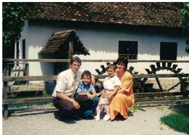
Pred leti z družino v muzeju v Bistri ...

nosti in je zdravstveno sposoben za opravljanje gasilske službe. Ne sme biti v kazenskem postopku in do sprejema službe ni bil pravnomočno obsojen zaradi naklepne kaznivega dejanja, ki se preganja po uradni dolžnosti, in ni bil obsojen na nepogojno kazen zapora v trajanju več kot šest mesecev. Star je najmanj 18 let in ne več kot 65. Zraven teh, z zakonom predpisanih pogojev, pa mora imeti čut do sočloveka, biti družaben, znati delati v skupini, saj pri nas posameznik ne pomeni veliko, šele skupaj smo močni in učinkoviti. Velikokrat poudarim, da gasilec ne more biti slab človek, saj je pripravljen vstati sredi noči, v kakršnem koli vremenu, pomagati ljudem v stiski, in pri tem nikoli ne ve, ali se bo vrnil živ.