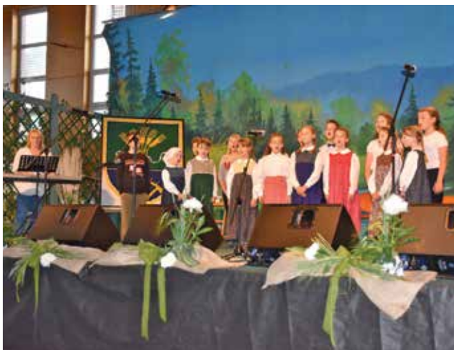
OPZ Starše, učenci tudi folklorniki ...