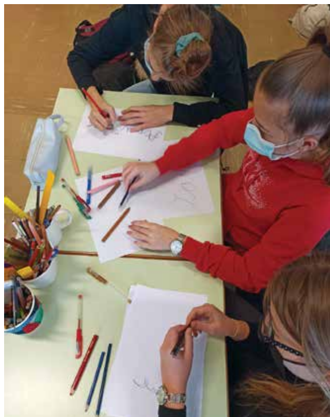
Devetošolke pri pisanju ...

Devetošolke se pri svojih zapisih vedno zelo potrudijo, zato so tudi njihovi zvezki vzorno urejeni. V Tednu pisanja z roko so se pri uri razširjenega programa Ustvarjalne roke poigravale z različno oblikovanimi črkami in z njimi