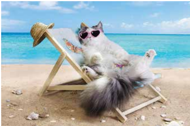
Sem »damica« na ležalniku ...

Pregledali smo najpogostejše zunanje in notranje zajedavce. Zunanji zajedavci so sploh poleti prava nadloga, zato je pomembno poznavanje le-teh, da jih lahko pravilno zatiramo. S tem se izognemo marsikateri nevšečnosti, vnetju kože, neprespani noči, bodisi na dopustu ali doma. Za pravilen program zatiranja se lahko posvetujemo s svojim veterinarjem, zadostuje pa vedenje, da lahko uspešno zatiramo zunanje in notranje zajedavce s kombiniranimi preparati. Preparati so v glavnem v obliki okusne tablete (za pse) oz. v obliki ampule ali tablete (za mačke). Včasih