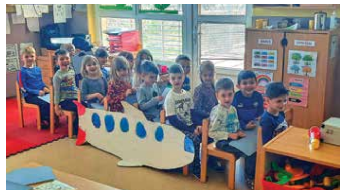
Potujemo z vlakom ...