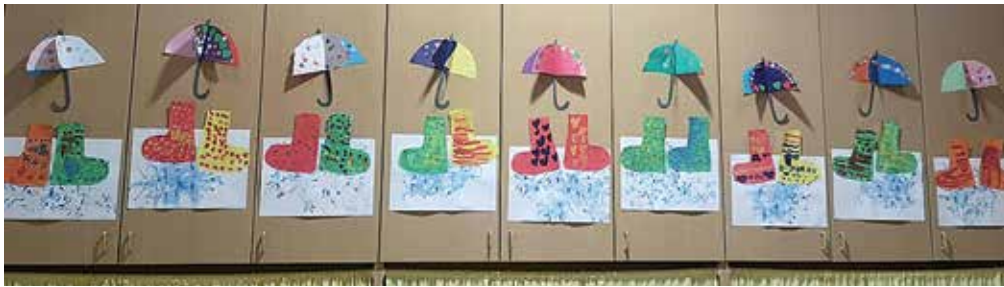
Dežni škornji in dežniki iz papirja ...

Pozimi smo se primerno oblekli in v vseh vremenskih pogojih bivali na svežem zraku. Izkusili smo sneg in snežne radosti, ko smo se igrali in dričali po hribu, odtisnili stopinje v snegu in primerjali le-te po velikosti – moje in njihove. V igralnico smo prinesli sneg in skupaj ugotavljali, kaj se z njim dogaja na toplem. V najbolj deževnem mesecu, mesecu aprilu, sva s sodelavko otroke seznanili s primernimi oblačili in obutvijo ter rahle deževne dni izkoristili s sprehodom po dežju. Izrezali in pobarvali smo si dežne škornje in dežnike iz papirja. Zelo smo uživali v igri s kapalkami. Vodne kapljice smo nakapljali na papir in jih s