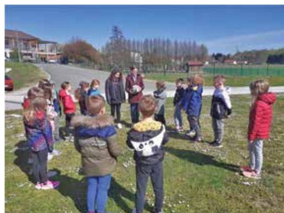
Igra med generacijama ...