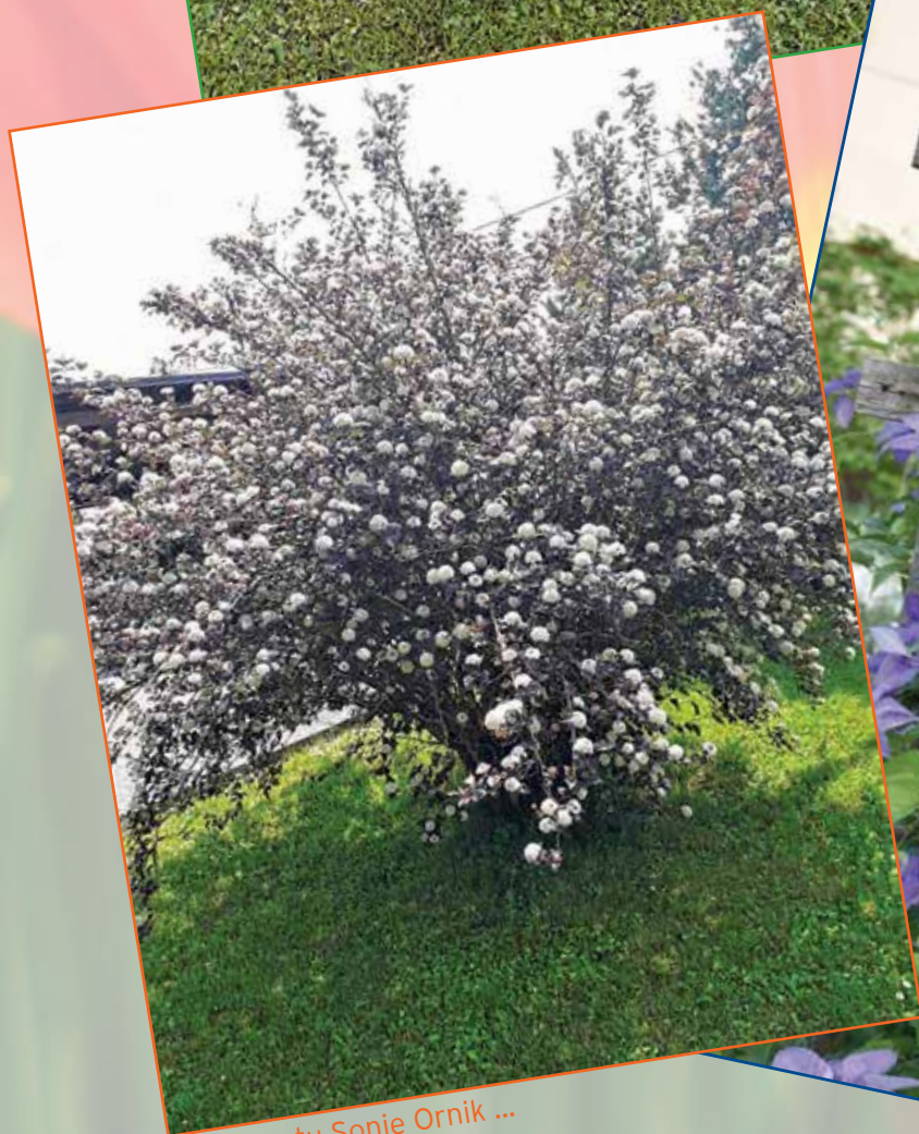
Na vrtu Sonje Ornik ...