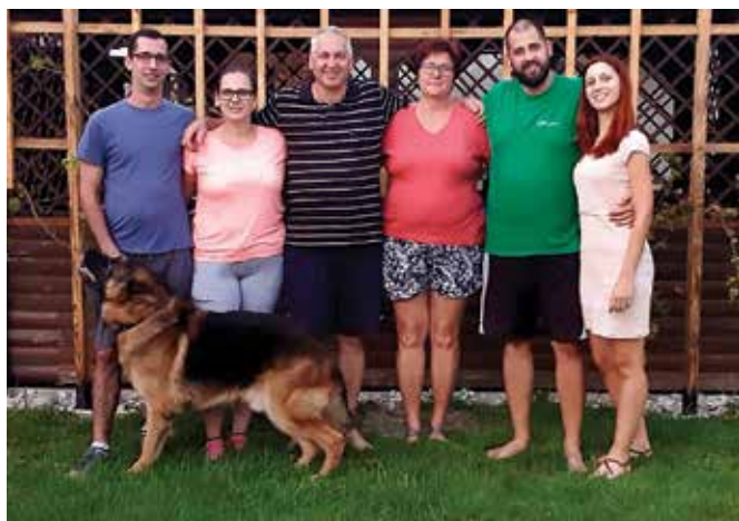
V krogu razširjene družine ...

bavnim programom, razstavo narodov in zabavno – »Lager« olimpijado. V centru mesta se bodo predstavili naši veterani, članice in mladi, prav tako želimo promovirati tekmovanje naših najmlajših pionirjev, starejših gasilcev in tekmovanje gasilskih dvojic. Na območju celjskega sejma in v centru mesta bo veliko različnih razstavljalcev, turistične in kulinarčne ponudbe, organiziran bo bogat kulturni in zabavni program. Pričakujemo udeležbo 23 držav z več kot 3.000 tekmovalci in sodniki. Da bo vse teklo kot mora, bo pomagalo več kot 2.000 prostovoljcev.