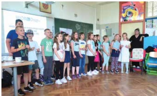
Nastop naših učencev ...