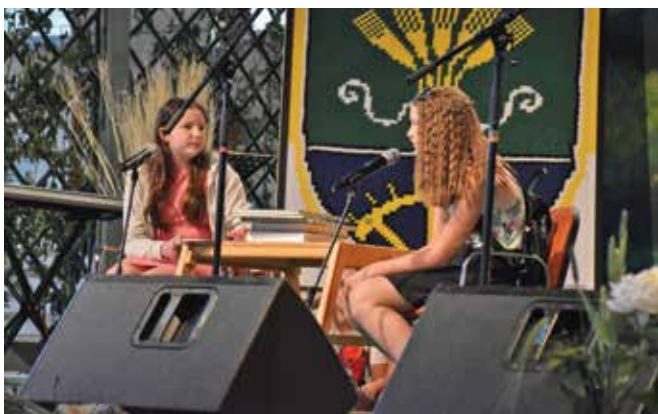
Utrinek z dramskega nastopa ...