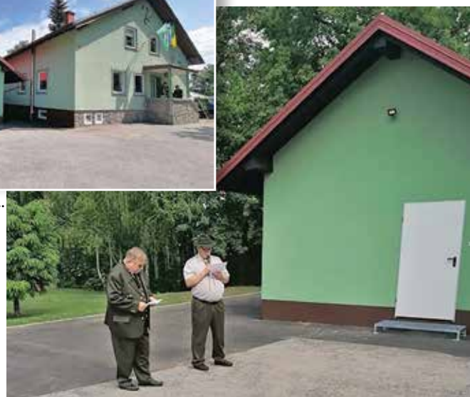
Starešina in tajnik LD Starše ...