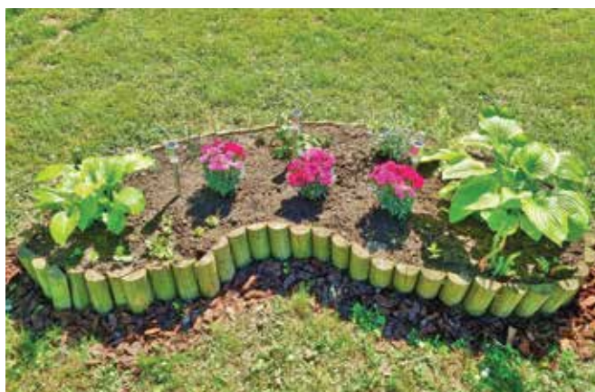
Cvetlična greda ...