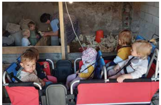
Obiskali smo kmetijo in opazovali piščančke ...