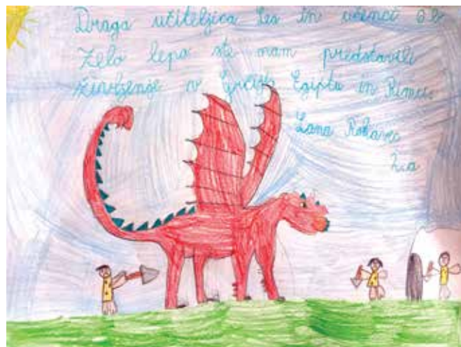
Evalvacija učenke ...

Pri evalvaciji tedna za spremembe smo dobili prav zanimive odgovore. Mlajši učenci si tudi v prihodnje želijo družbe, igre in pomoči starejših, učenci predmetne stopnje pa želijo še naprej navduševati, osrečevati učence razredne stopnje in jim pomagati pri učenju ter opravljanju nalog. Prav tako si tudi v prihodnje želijo še kakšen dan brez domačih nalog.