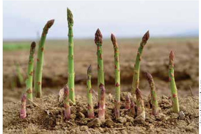
Šparglji ohranjajo zdravje ...

Vijolični beluši so novost v svetu belušev. Navzven so močne burgundske barve, imajo pa smetanasto meso.