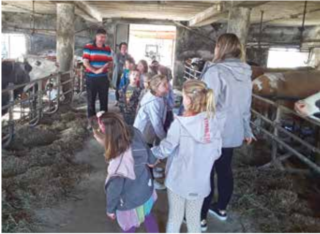
Na kmetiji je lepo ...

zanimivega o mleku in mlečnih izdelkih. Posebno izkušnjo so doživeli ob maketi krave, kjer so se lahko preizkusili v molži.