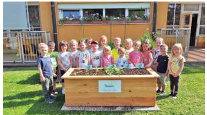
Nova visoka greda ...

sem priložila tudi deklamacijo Visoka greda Pampers. Izmed 98 prijavljenih vrtcev je bil med nagrajenci tudi naš vrtec Pikapolonica. Nova visoka greda že stoji in otroci so je zelo veseli. Vanjo smo že posadili solato in redkvico ter posejali peteršilj in korenček.