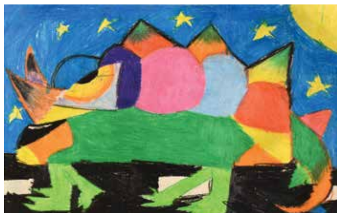
Meta Horvat, 4. b