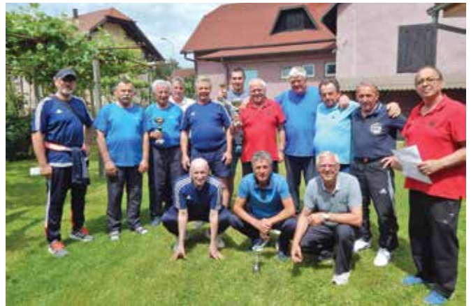
Uspešna kegljaška ekipa ...