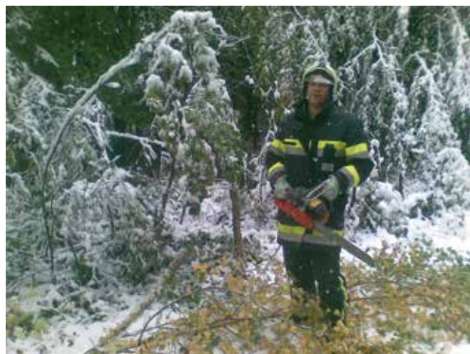
Intervencija v času žledoloma ...