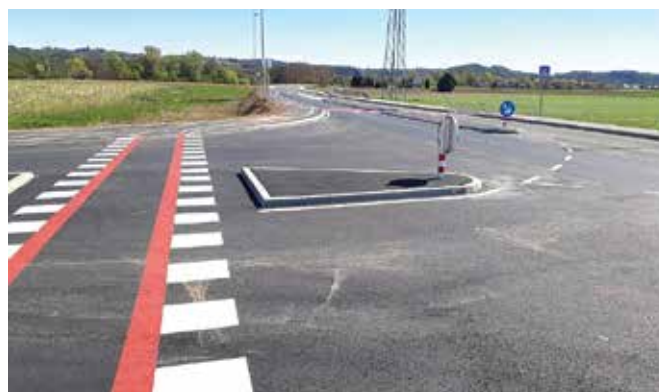
Urejeno cestišče v smeri do obrtne cone ...