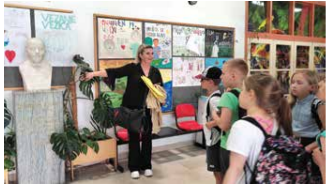
V OŠ Stjepana Radića v Božjakovini ..

Nato pa smo jim odigrali igro Barve. Dramatizacijo smo ustvarili po knjigi, ki smo jo brali. Ker se nam je