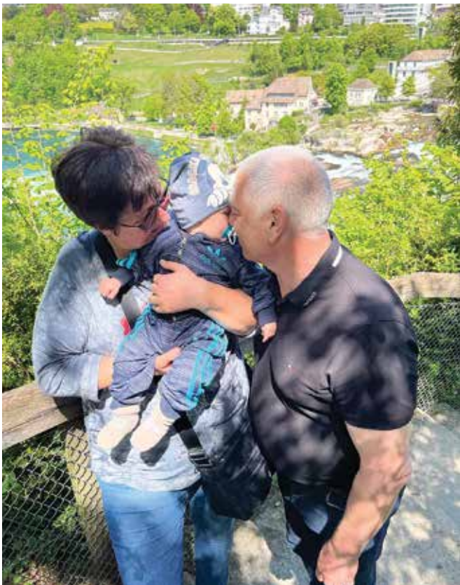
Vnuk Jaka prinesel veselje v družino ...