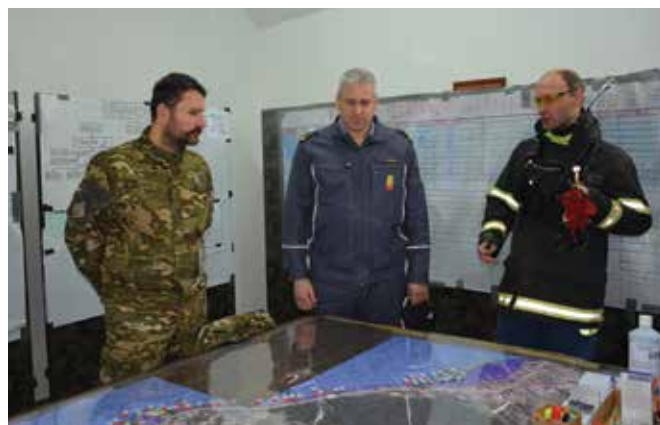
Ob poplavah na Planinskem polju ...

Biti gasilec je način življenja in vpliva na vse člane v družini. Z ženo sva se že pred poroko dogovorila, da je gasilstvo del mojega življenja. Prav gotovo ji ni bilo vedno lahko. Sicer pa me je vedno podpirala pri mojem delu,