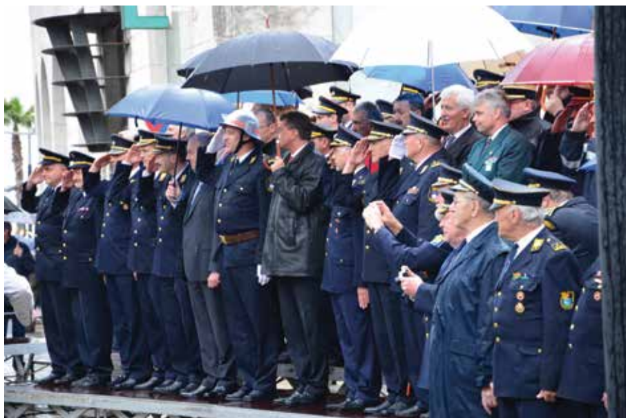
Kongres v Kopru 2013; prvič izvoljen ...